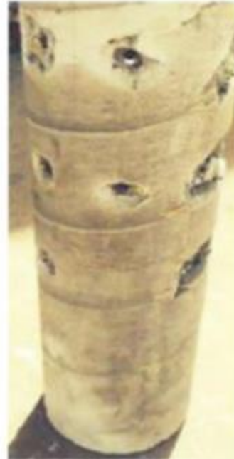
Target post pulsing

تصویر شماره ۳- قبل و بعد از در معرض پالس پلاسما قرار گرفتن مغزه