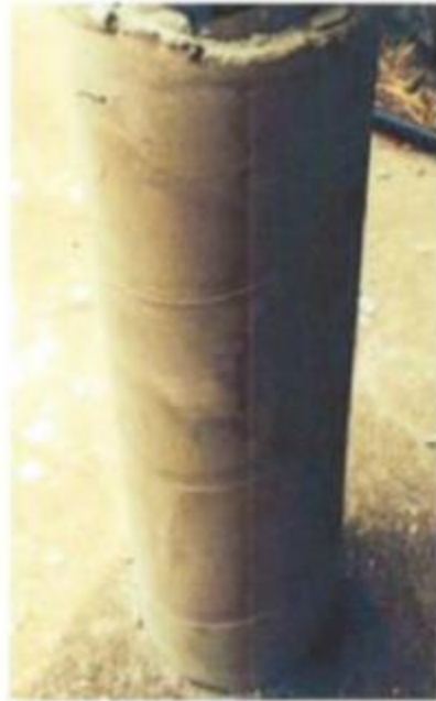
Simulated blocked perforated casing target before pulsing