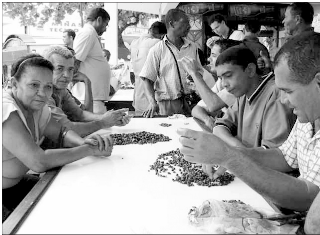
▲ اگرچه برخی از زنان در تجارت گوهرها در برزیل حضور دارند، اما این نقش تا حد زیادی تحت سلطه‌ی مردان است

سرعت بخشیدن به شناسایی نیازهای جنسیتی بسیار مفید باشند (مثلاً مسایل مربوط به روش‌های استخراج از معادن، مسایل ایمنی، تقسیم کار، دسترسی و مدیریت آب و حضور موسسات مالی کوچک و بانک‌های تجاری).