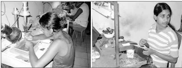
▲ پشتیبانی و آموزش زنان جوان برای حضور در زنجیره ارزش افزوده در حوزه‌ی سنگ‌های قیمتی و نیمه قیمتی در سری‌لانکا و برزیل که این حوزه در این کشورها مزایای قابل توجهی ایجاد کرده‌اند.