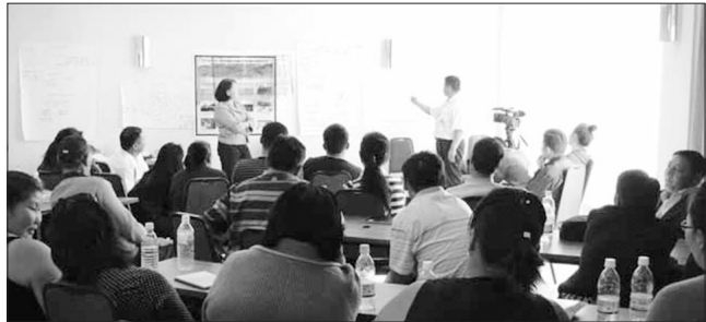
▲ مردان و زنان معدنچی فعال در انجمن معدنچیان منطقه، مغولستان