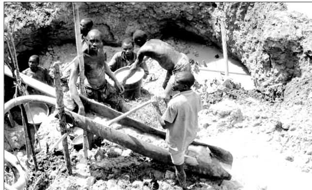
▲ معدنچیان مرد شاغل در یک معدن طلا

ارزیابی نیازهای آموزشی خود را با یک ابتکار جداگانه برای تعیین این نیازها انجام دهید. این کار به شما اطمینان می‌دهد که هر نوع آموزشی پاسخگوست و به نیازهای جنسیتی اجرایی و استراتژیک کمک می‌کند. * مفاهیم اساسی: