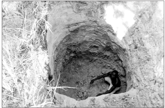
▲ معدنچی ژیبس

پرداختن به نقاط ضعف، استفاده از دارایی‌ها و نیز ایجاد فرآیندهای موثر بر آن‌ها فراهم خواهند کرد که نهایتاً باید منجر به شناسایی نیازهای اولویت توسعه و منافع زنان و مردانی شود که بر معیشت و کیفیت زندگی آن‌ها اثرگذار باشد. خصوصاً بسیار مهم است که درک کنیم وقتی تغییرات اساسی در معیشت زنان و مردان رخ می‌دهد، موجب تغییر وضعیت خود آن‌ها خواهد شد. همچنین مهم است که بدانید چگونگی برخورد با نیازهای جنسیتی استراتژیک باعث بهبود زندگی مردان و زنان خواهد شد.