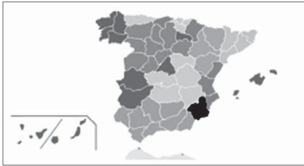
▲ نقشه کشور اسپانیا و محل ایالت مورد نظر

امکان ایجاد فعالیت‌های اقتصادی دیگر، افزایش تعداد بیکاران و غیره گردید.