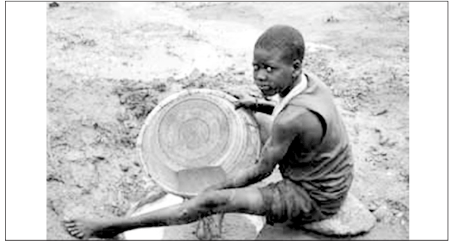
▲ شکل ۱- درک ارتباط بین کودکان کار و نابرابری‌های جنسیتی در ASM به کسب اطلاعات در خصوص استراتژی متمرکز بر حقوق فقرا کمک خواهد کرد

از شرکت‌کنندگان درباره‌ی جنسیت، قوانین و حقوق و توسعه را در دیوارهای مختلف ساختمان قرار دهید.