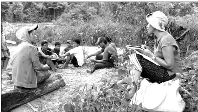
▲ مصاحبه با معدنچیان

- سوالات تفسیری: ممکن است روش بیان، بخشی از پرسشنامه‌ی شما باشد. از جمله بیان «بنابراین منظور شما این است که...؟»، «آیا این درست است که شما...؟»، «آیا این به این معنی است که...؟».