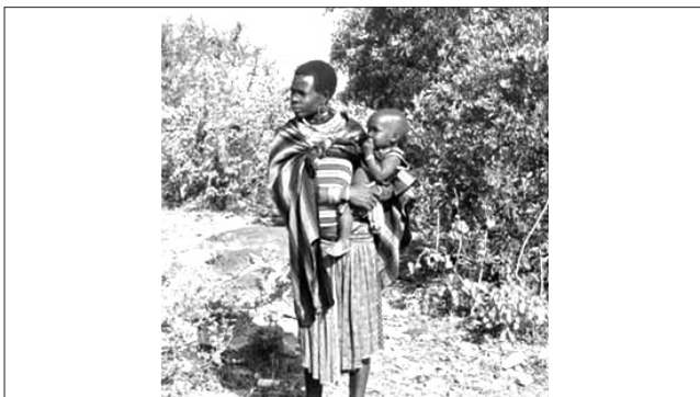
▲ یک زن معدنچی در معدن سنگ تزئینی که در زمان استراحت از کودکش مراقبت می‌کند

مرحله دوم: قبل از هرگونه جمع‌آوری اطلاعات، اهداف ارزیابی را معرفی کنید و مطمئن شوید که شرکت‌کنندگان به این درک رسیده باشند که هر گونه اطلاعاتی که ارایه کنند، به‌طور محرمانه نگهداری می‌شود. اگر از ضبط صدا استفاده می‌کنید، باید کدگذاری شوند و در یک مکان