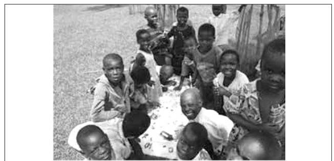
▲ آرایه خدمات مراقبت از کودکان در گروه‌های متمرکز می‌تواند به حضور زنان در نمونه‌گیری کمک کند

اگر شما بر تمام زنجیره‌ی تولید و تجارت مواد معدنی تمرکز کنید، لازم است تا بر خریداران و فروشندگان و همچنین افراد موثر در ایجاد ارزش افزوده مواد معدنی (به عنوان مثال سازندگان طلا و جواهر) و فعالان سایر فعالیت‌های مکمل نیز متمرکز شوید. به خاطر داشته باشید که آگاهان کلیدی اغلب به دوستان، اعضای خانواده و همکاران خود توصیه‌هایی می‌کنند. بنابراین می‌تواند برای شناسایی نقاط شروع مستقل اضافی مفید باشد. ممکن است شما در حال حاضر چند مخاطب در جامعه (یا جوامع) درگیر داشته باشید اما اگر ندارید، بازدید میدانی از سایت ASM می‌تواند نقطه شروع مستقل خوبی باشد.