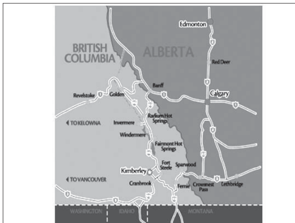
شکل ۱- نقشه منطقه کیمبرلی

بقایای شهر کیمبرلی (واقع در کوه‌های جنوب شرقی بریتیش کلمبیا) داستان موفقیت‌آمیز ویژه‌ای است. هدف ما در این مطالعه بررسی کیمبرلی برای کشف دلایل موفقیت پروژه، چگونگی رهایی شهر از وابستگی به معدن و اقتصاد مواد معدنی و تبدیل به جامعه‌ای زنده، با فرهنگ غنی، تاریخ، گردشگری، تفریح، ورزش، جشنواره‌ها و محیط طبیعی با عناصر