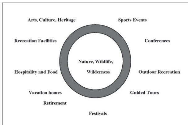
▲ شکل ۴- توسعه گردشگری در کیمبرلی

گروه‌های سنی به یکی دیگر از امکانات این شهر که همان نزدیکی به طبیعت بکر و دست نخورده بود کمک می‌کرد.