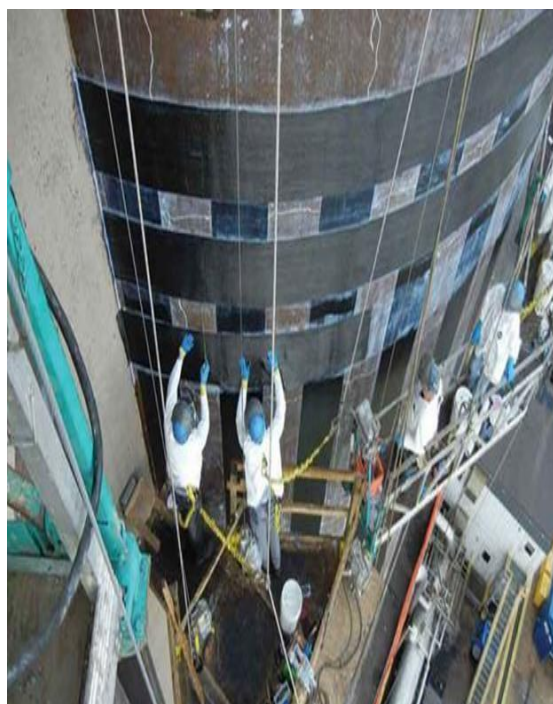
STEP 1: VERTICAL STRIPS

سیلوی بتن مسلح بدنه ای استوانه ای با دیواره نازک است که برای ذخیره مواد دانه ای آهن اسفنجی، اهک و غیره استفاده می شود. این سیلوها به طور گسترده ای در انبارهای مدرن صنایع سبک و غیره استفاده می شود. با این حال، به دلیل استانداردهای کم در طراحی هنگام ساخت، مصالح ساختمانی محدود، آسیب خوردگی از محیط های طبیعی و تخریب در استفاده عادی برخی سیلوهای بتنی به مرور با مشکلاتی مانند کاهش برافیت، ترک ها و آسیب های سازه ای روبرو می شوند که به طور جدی بر استفاده طبیعی از آنها تاثیر میگذارد و مسائل ایمنی خاصی را به همراه دارد. لمینت ها و الیاف کربن (CFRP) نوع جدیدی از مصالح مقاوم سازی کامپوزیت هستند.