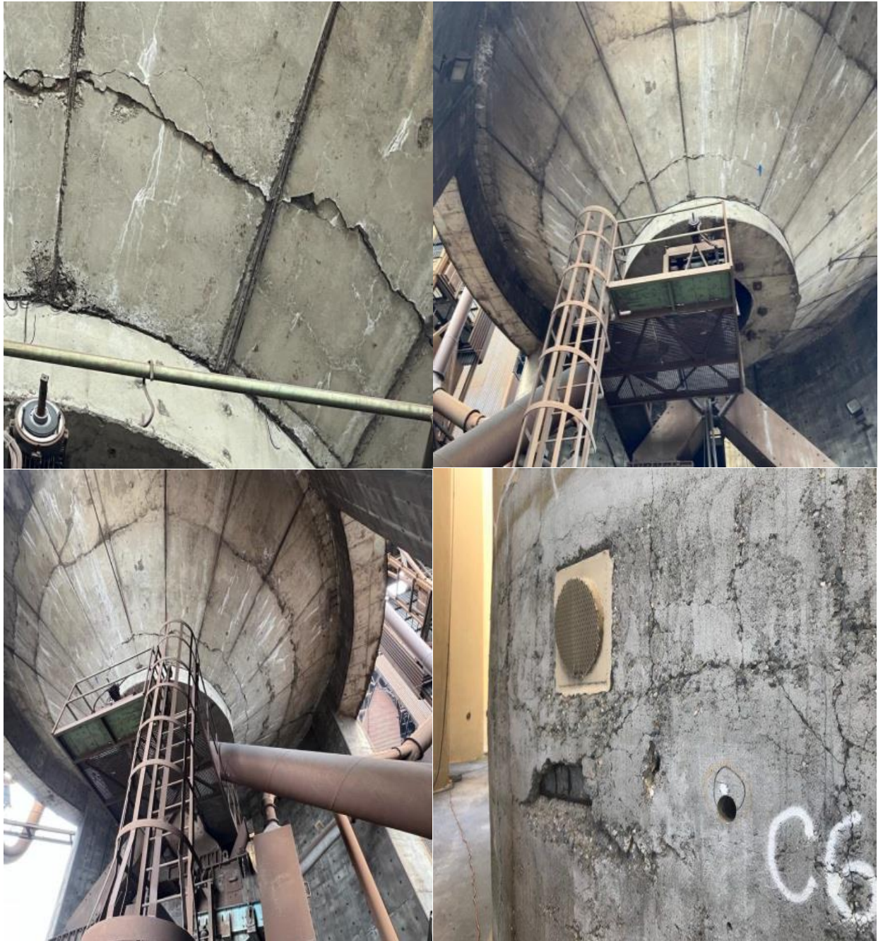
عکس هاو تصاویر شماره ( ۴،۲،۳،۱ ) نمایانگر نوع و علل ترک به وجود آمده را نشان می دهد