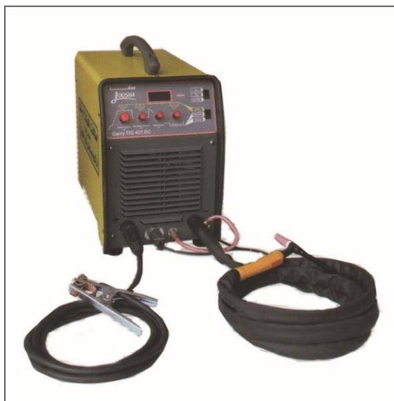
شکل ۱: نمونه ای از دستگاه رکتیفایر

در شماره های بعد، مطالب اختصاصی پیرامون دستگاه های جوشکاری و کاربرد وسیع آنها، همچنین الکترودهای جوشکاری، تقدیم دوست داران و علاقمندان این صنعت، خواهد شد لازم بذکرست در عملیات معلوم سازی چنانچه با الکتروود جوشکاری شود حتماً باید از دستگاه رکتیفایر (DC) استفاده شود.